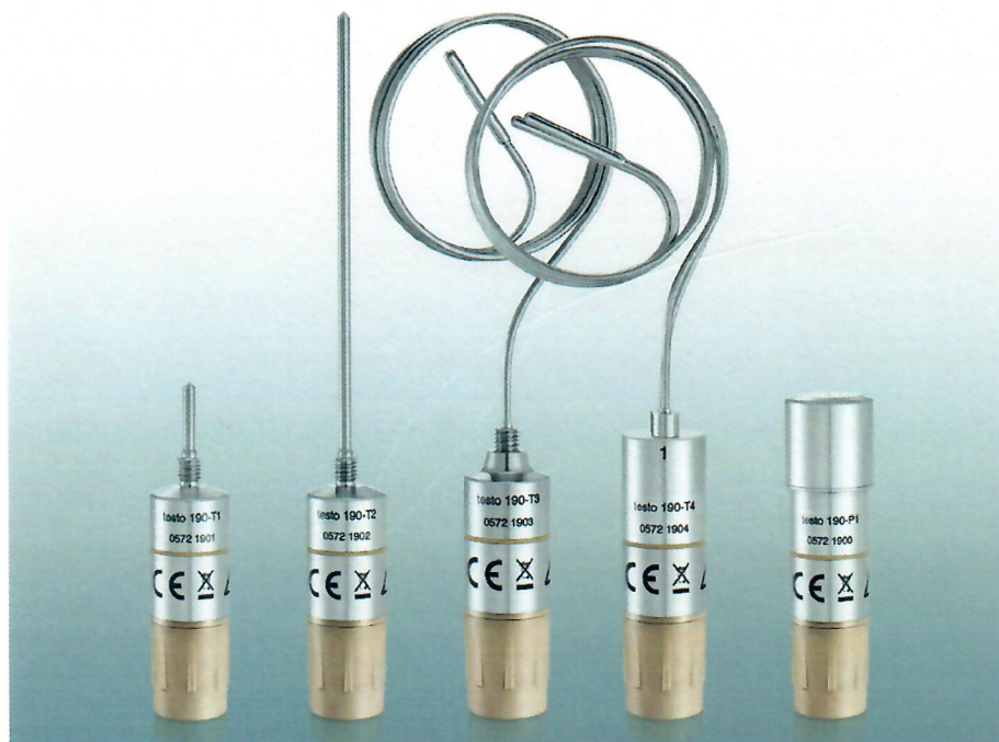
Testo 190-T1 Testo 190-T2 Testo 190-T3 Testo 190-T4 Testo 190-P1

Для считывания накопленной информации регистраторы подключаются к персональному компьютеру с помощью блока считывания и конфигурации (рисунок 2) и USB-кабеля.