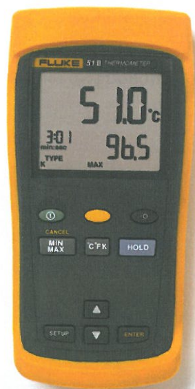
Рис. 1. Измеритель температуры цифровой Fluke серии II модели 51

Фотографии внешнего вида измерителей температуры цифровых Fluke серии II моделей 51, 52, 53, 54 показаны на рисунках 1-4.