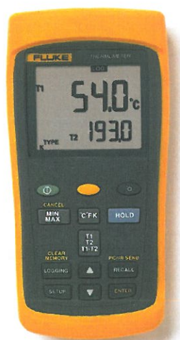
Рис. 4. Измеритель температуры цифровой Fluke серии II модели 54