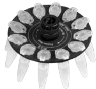
R-1.5 BS-010205-AK ротор

Ротор для 12 x 0.5 мл и 12 x 0.2 мл пробирок