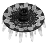
R-0.5/0.2 BS-010205-BK ротор

Ротор для 12 x 0.5 мл и 12 x 0.2 мл пробирок