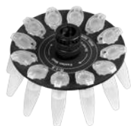
R-1.5 BS-010205-AK ротор

Ротор для 12 x 0.5 мл и 12 x 0.2 мл пробирок