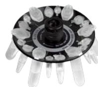
R-2/0.5/0.2 BS-010205-DK ротор

Ротор для 8 x 2/1.5 мл и 8 x 0.5 мл пробирок