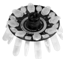
R-2/0.5 BS-010205-CK ротор

Ротор для 8 x 2/1.5 мл и 8 x 0.5 мл пробирок