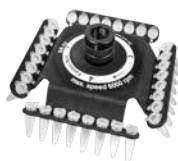
SR-32 BS-010205-FK ротор