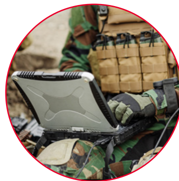
Связь специального назначения