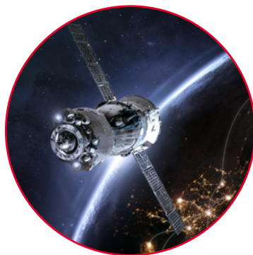
Космическая и спутниковая связь