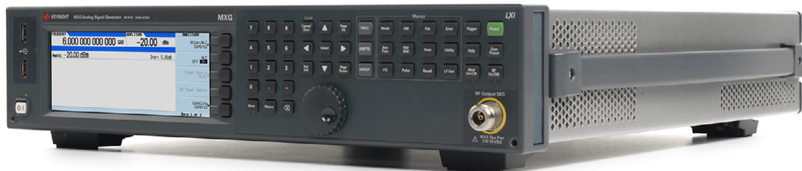
Аналоговый генератор ВЧ сигналов N5181B MXG серии X