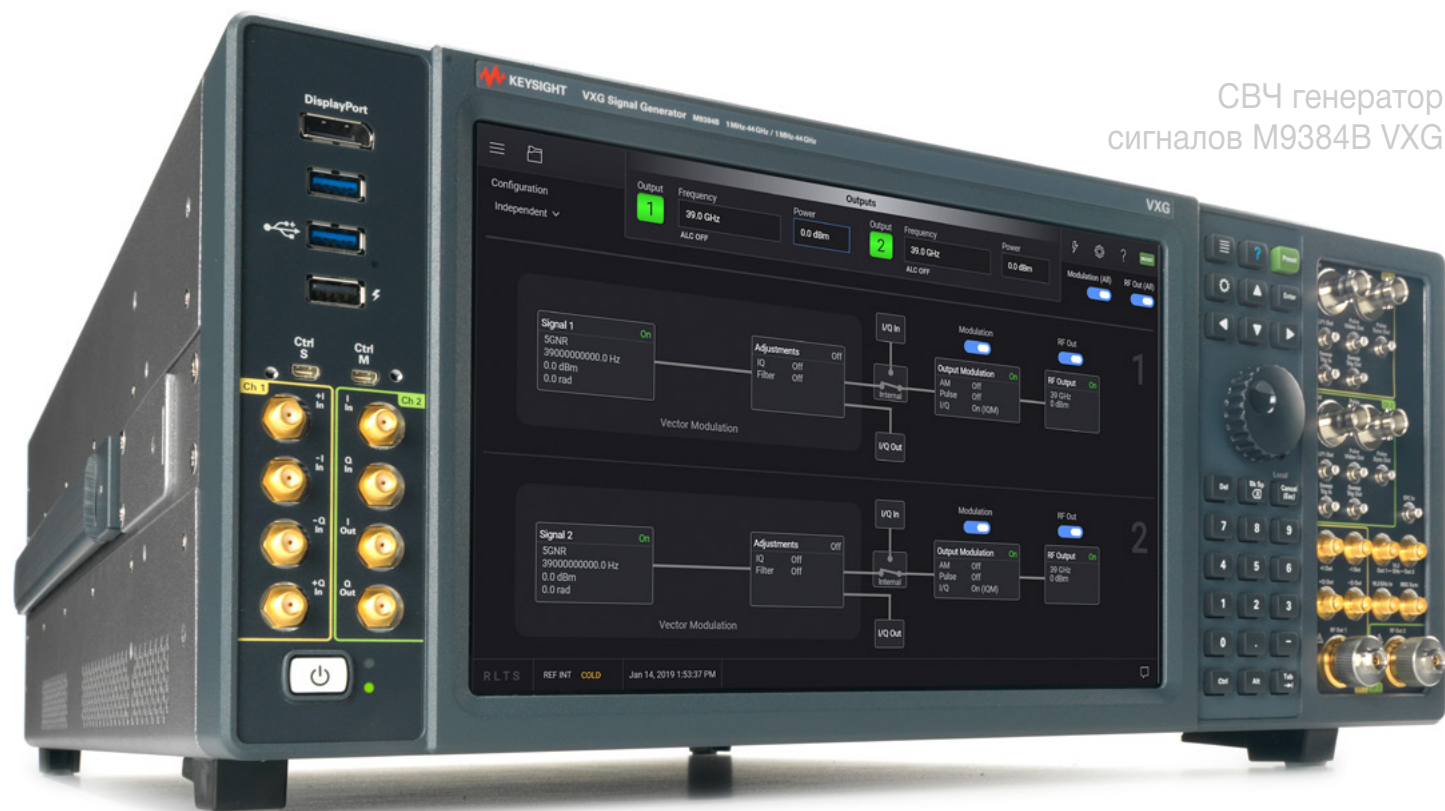
СВЧ генератор сигналов M9384B VXG