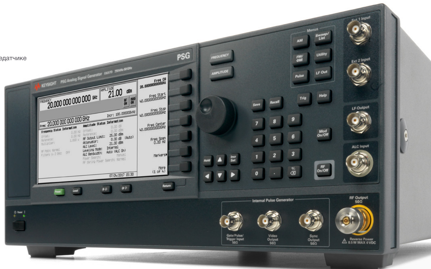
Аналоговый генератор сигналов E8257D PSG