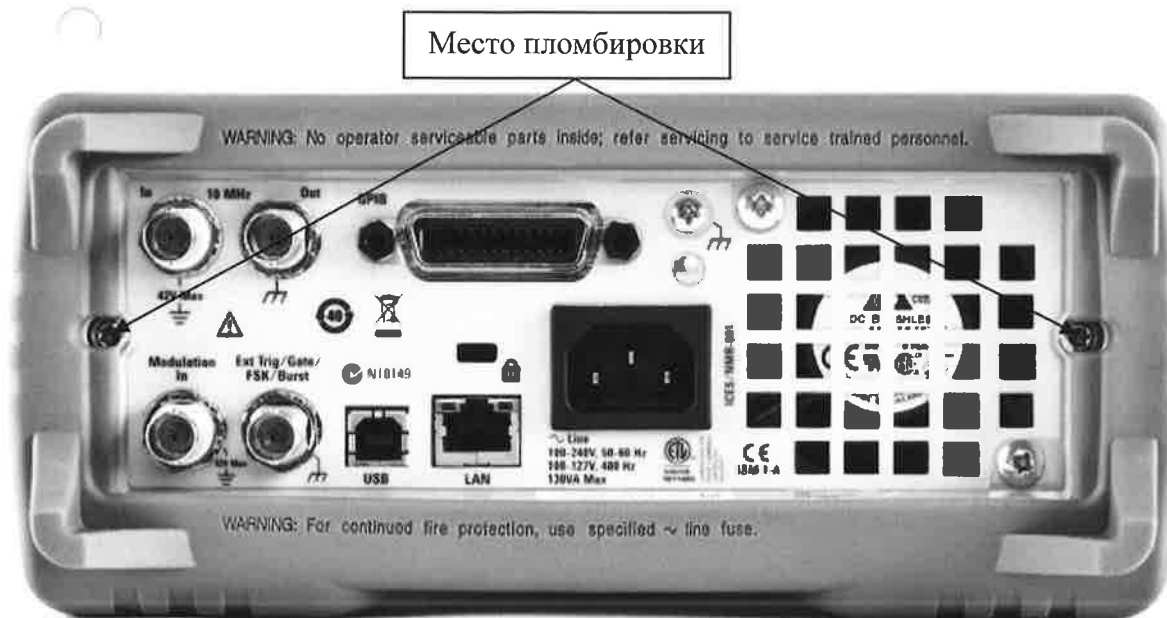
Рисунок 2 – Схема пломбировки от несанкционированного доступа