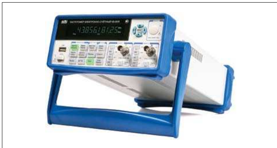
Рис. 1. Внешний вид частотомеров ЧЗ-85/4, ЧЗ-85/5, ЧЗ-85/6

чтобы потом получить \Delta T_1 и \Delta T_2 , то есть преобразовать временные интервалы в цифровой код. Все вычислительные функции