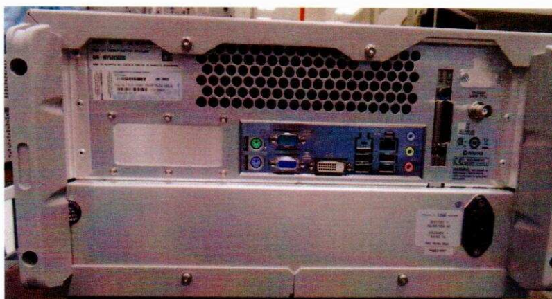
Рисунок 2 - Схема размещения наклеек от несанкционированного доступа