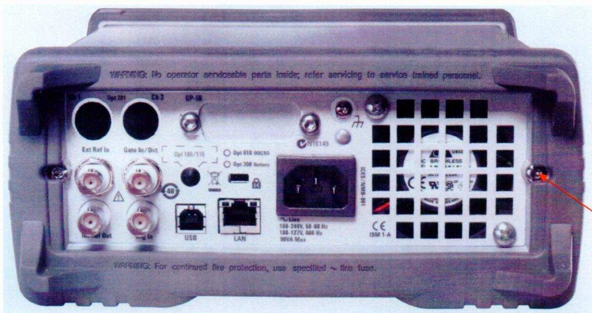
◆ - Место пломбировки от несанкционированного доступа Рисунок 2 – Внешний вид задней панели частотомеров