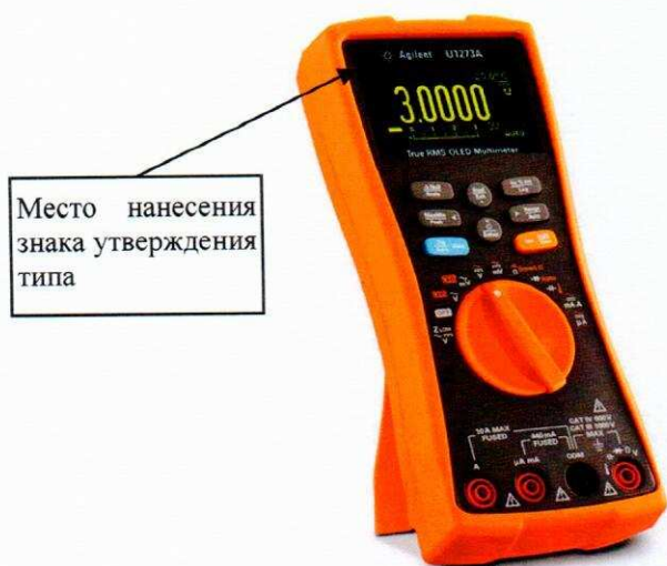
Место нанесения знака утверждения типа