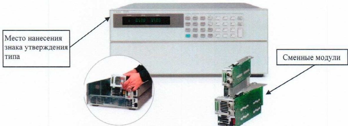
Рисунок 1 – Внешний вид базового блока нагрузок электронных N3300A