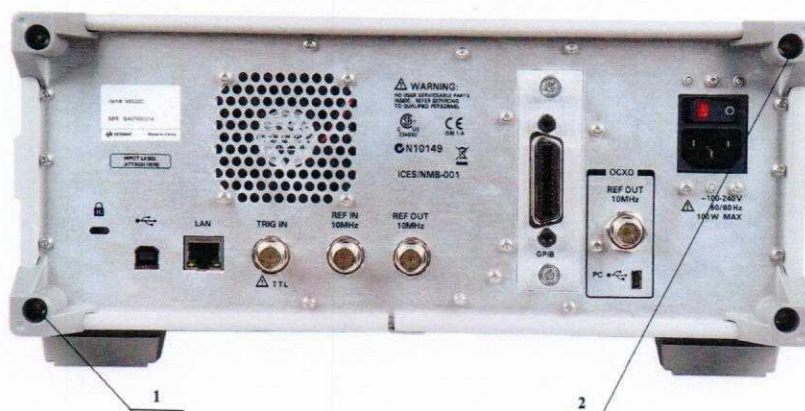
Рисунок 2 – Схема пломбировки анализаторов от несанкционированного доступа, где 1; 2 – места для нанесения оттисков клейм.

Схема пломбировки от несанкционированного доступа приведена на рисунке 2.