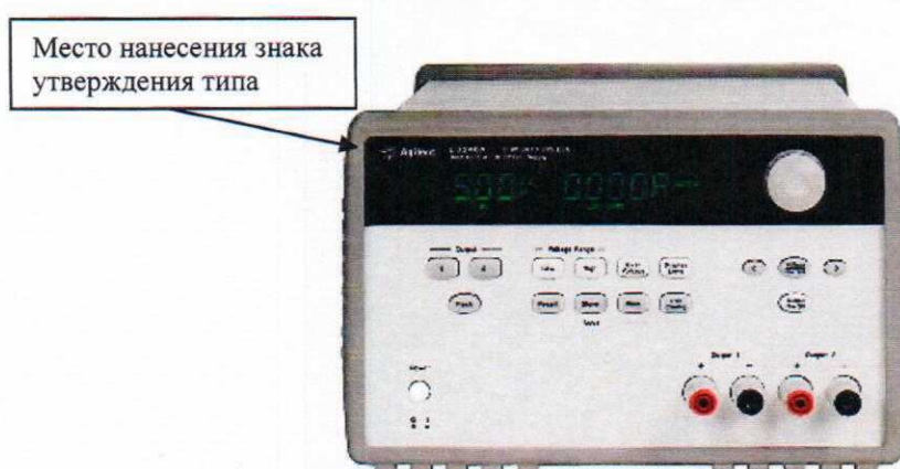
Рисунок 3 – Внешний вид мер E3646A, E3647A, E3648A, E3649A