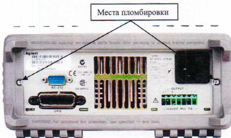
Рисунок 2 - Схема пломбировки мер E3640A, E3641A, E3642A, E3643A, E3644A, E3645A