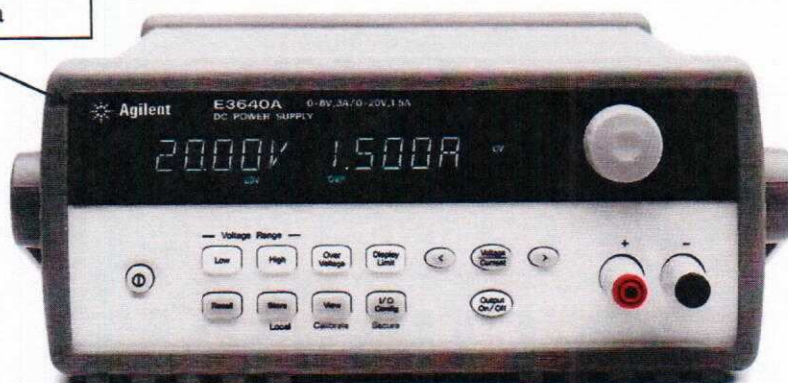
Рисунок 1 – Внешний вид мер E3640A, E3641A, E3642A, E3643A, E3644A, E3645A