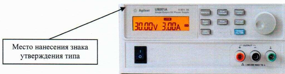
Рисунок 1 - Внешний вид источника питания постоянного тока U8001A

При оформлении внешнего вида источников питания могут использоваться логотипы компаний «Agilent Technologies» или «Keysight Technologies».