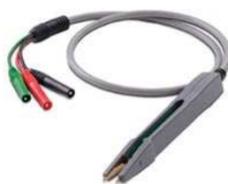
U1782A – Измерительный кабель с пробником для элементов SMD