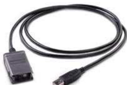
U5481A – Кабель IR-USB