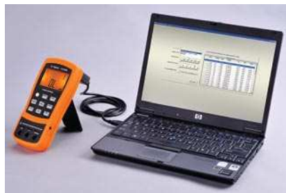
Рис. 1. Автоматизированная регистрация результатов измерений при подключении U1701A/U1701B к ПК

U1701A/U1701B обладает и другими удобными функциями, включая режим контроля допусков и режим относительных измерений, удержание результата измерения, запись минимального/максимального/среднего значений, а также регистрацию данных на ПК.