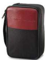
U1174A – Мягкая сумка для переноски