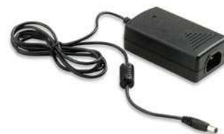
U1780A – Адаптер для питания от сети переменного тока и сетевой кабель для выбранной страны