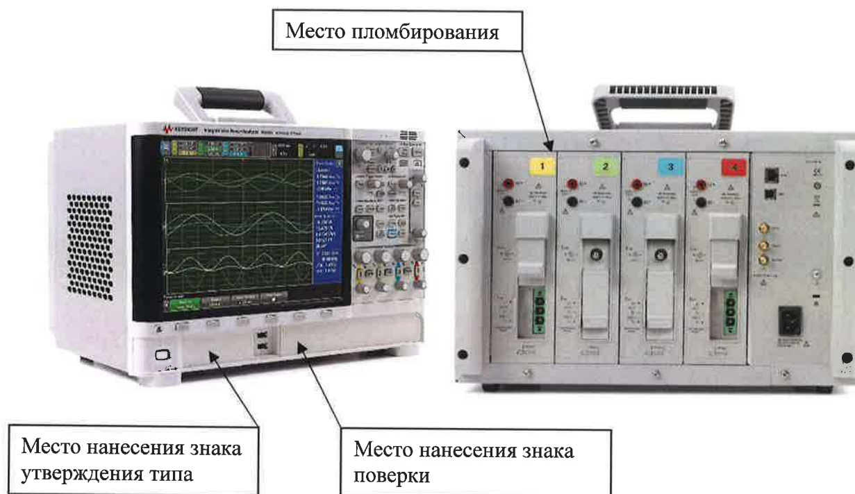
Рисунок 2 - Общий вид анализаторов PA2203A