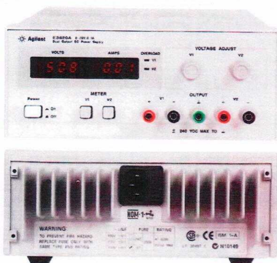
Источники питания E3620A

Для предотвращения несанкционированного доступа к внутренним частям приборов один из винтов крепления корпуса пломбируется.