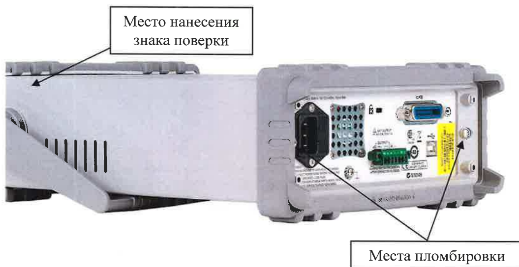
Рисунок 3 – Схема пломбировки от несанкционированного доступа, обозначение места нанесения знака поверки