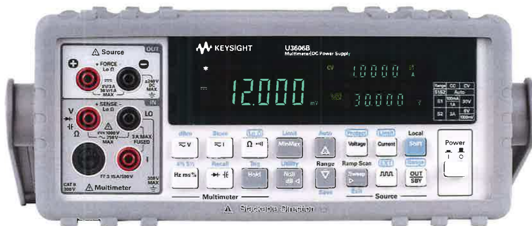
Рисунок 1 – Общий вид мультиметров цифровых/источников питания U3606B. Передняя панель