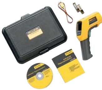
Fluke 566 с комплектом принадлежностей