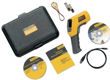
Fluke 568 с комплектом принадлежностей