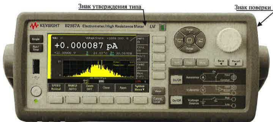
Рисунок 2 – Внешний вид измерителей малых токов B2985A и B2987A

Схема пломбировки от несанкционированного доступа представлена на рисунках 3, 4.