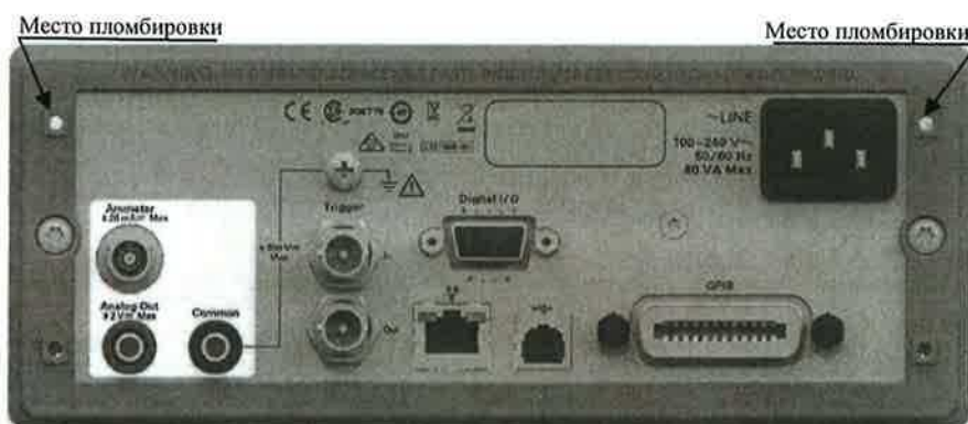
Рисунок 3 – Схема пломбировки от несанкционированного доступа измерителей малых токов B2981A и B2983A

Схема пломбировки от несанкционированного доступа представлена на рисунках 3, 4.