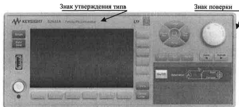
Рисунок 1 – Внешний вид измерителей малых токов B2981A и B2983A

Общий вид измерителей с указанием мест размещения знака утверждения типа и знака поверки представлены на рисунках 1, 2.