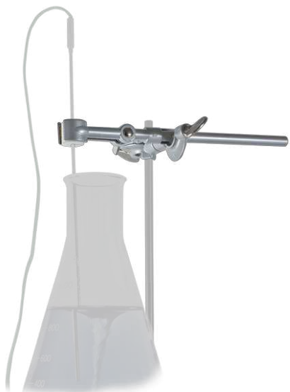
НТР-1 BS-010309-FK держатель