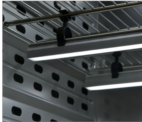
Световая планка 50 см, прикреплена при помощи пластиковых зажимов® к решетчатой вставной полке