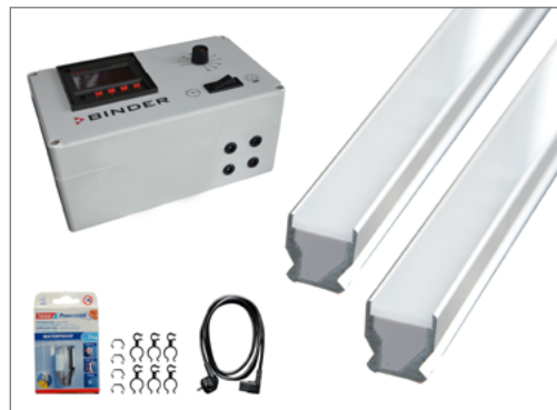
Комплект поставки базового набора