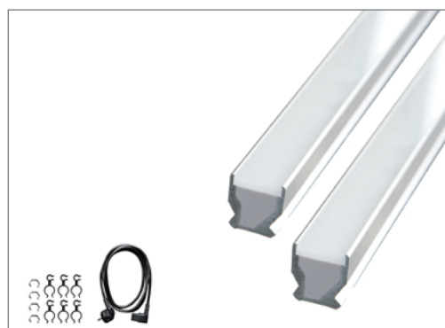
Комплект поставки набора для расширения