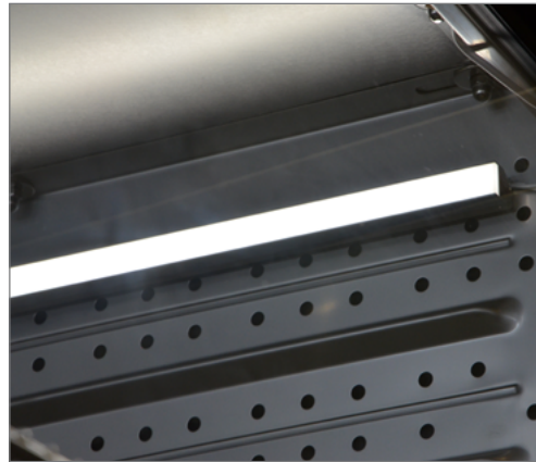
Световая планка 30 см, прикреплена при помощи tesa Powerstips® к стенке камеры