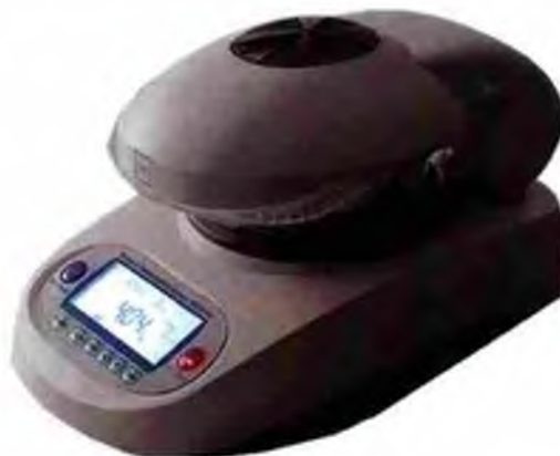
Рисунок 1 — Общий вид анализаторов

Общий вид анализаторов показан на рисунке 1.