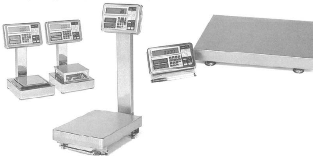
Рисунок 1 - Общий вид весов неавтоматического действия FS, FZ

Весы снабжены следующими устройствами и функциями (в скобках указаны соответствующие пункты ГОСТ OIML R 76-1-2011):