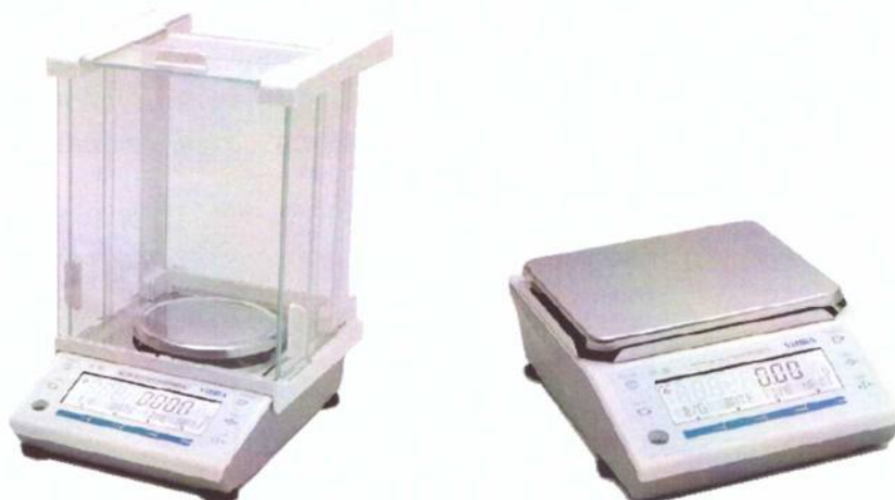
Рисунок 1 - Общий вид весов неавтоматического действия ALE

Общий вид весов представлен на рисунке 1.