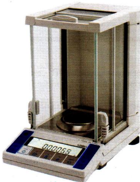
Рисунок 1 - Общий вид весов неавтоматического действия АФ.

Принцип действия весов основан на компенсации массы взвешиваемого груза электромагнитной силой, создаваемой системой автоматического уравнивания. Электрический сигнал, изменяющийся пропорционально массе взвешиваемого груза, преобразуется в цифровой код. Результаты взвешивания выводятся на дисплей.