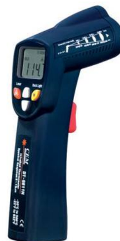
Рис.4. Пирометры инфракрасные моделей DT-8810, DT-8811, DT-8812, DT-8810H, DT-8811H, DT-8812H