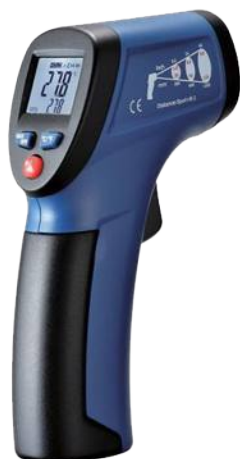
Рис.1. Пирометры инфракрасные моделей DT-810, DT-811, DT-812