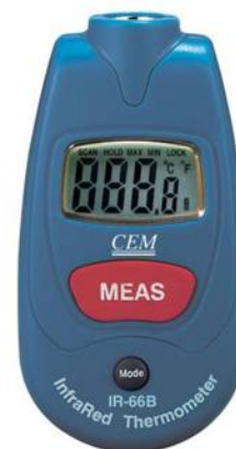
Рис.11. Пирометры инфракрасные моделей IR-66, IR-66B