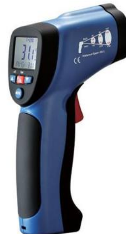
Рис.6. Пирометры инфракрасные моделей DT-8830, DT-8833, DT-8833H, DT-8835