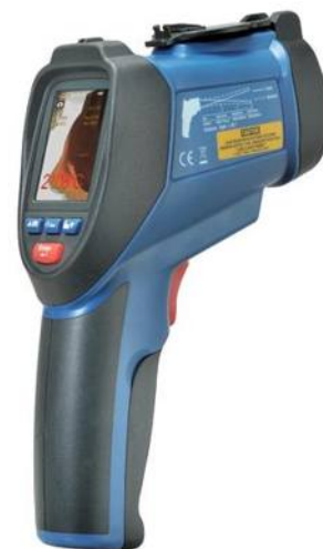
Рис.10. Пирометры инфракрасные моделей DT-9860, DT-9861, DT-9862, DT-9863, DT-9865