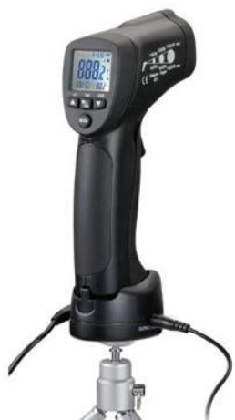
Рис.7. Пирометры инфракрасные моделей DT-8855, DT-8856