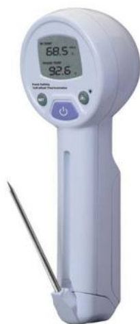
Рис.15. Пирометры инфракрасные модели IR-97