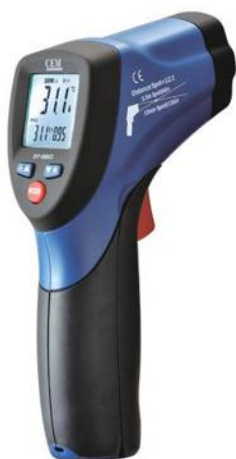
Рис.8. Пирометры инфракрасные моделей DT-8862, DT-8862B, DT-8863, DT-8863B, DT-8865