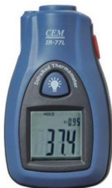
Рис.13. Пирометры инфракрасные моделей IR-77L, IR-77H