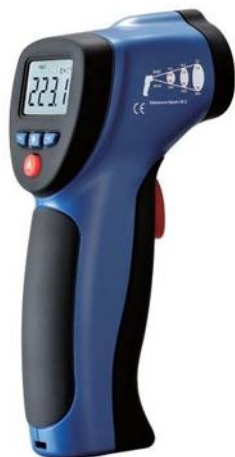
Рис.2. Пирометры инфракрасные моделей DT-880, DT-880H, DT-882, DT-882H, DT-883, DT-883H, DT-8801, DT-8802