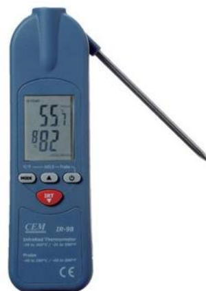
Рис.16. Пирометры инфракрасные модели IR-98