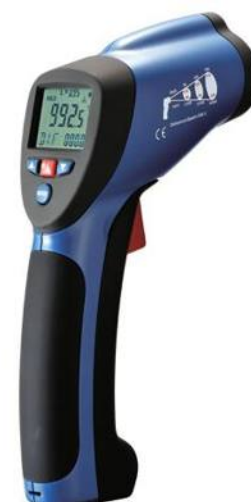
Рис.5. Пирометры инфракрасные моделей DT-8818, DT-8818H, DT-8819, DT-8819H, DT-8826H, DT-8828, DT-8828H, DT-8829, DT-8838, DT-8839, DT-8858, DT-8859, DT-8859H