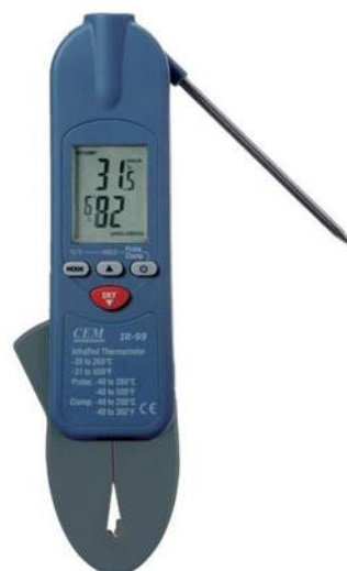
Рис.17. Пирометры инфракрасные модели IR-99