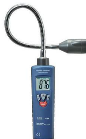
Рис.12. Пирометры инфракрасные модели IR-68