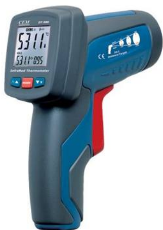
Рис.3. Пирометры инфракрасные моделей DT-980, DT-981, DT-982