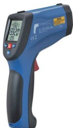
Рис.9. Пирометры инфракрасные моделей DT-8867H, DT-8868, DT-8868H, DT-8869, DT-8869H, DT-8878, DT-8879, DT-8889, DT-8889H