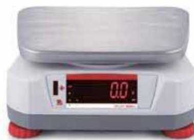
Тыльный дисплей со встроенным бесконтактным датчиком.

Используя два ярких светодиодных дисплея (передний и задний), одновременно несколько операторов могут выполнять однотипные операции взвешивания на одних и тех же весах. Даже в не самых благоприятных условиях большие яркие дисплеи позволяют без труда считывать результаты взвешивания с большого расстояния. Благодаря двум дисплеям весы также удобно использовать в розничной торговле. Наличие больших дисплеев спереди и сзади позволяет использовать весы Valor 4000 в розничной торговле, где покупатель должен видеть вес взвешиваемого товара.