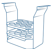
TR-5/30 BS-010406-КК штатив

Штатив для пробирок \varnothing 30 мм, емкость 5 пробирок