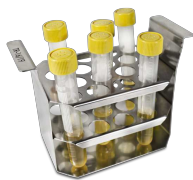
TR-16/19 BS-010406-FK штатив

Штатив для пробирок \varnothing 30 мм, емкость 5 пробирок