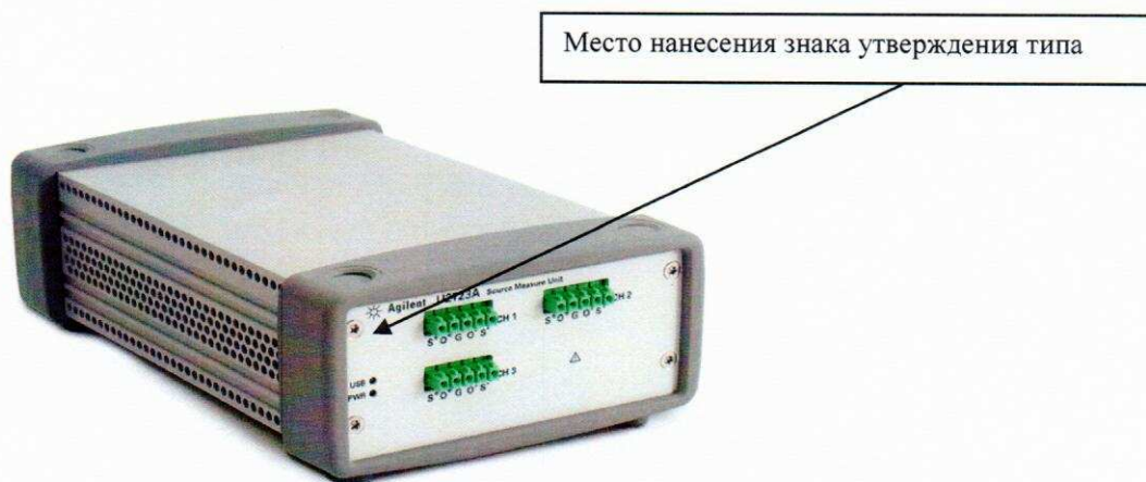
Рисунок 1 - Внешний вид лицевой панели источников питания

Внешний вид источников с указанием места нанесения знака утверждения типа и мест пломбировки от несанкционированного доступа приведен на рисунках 1 и 2.